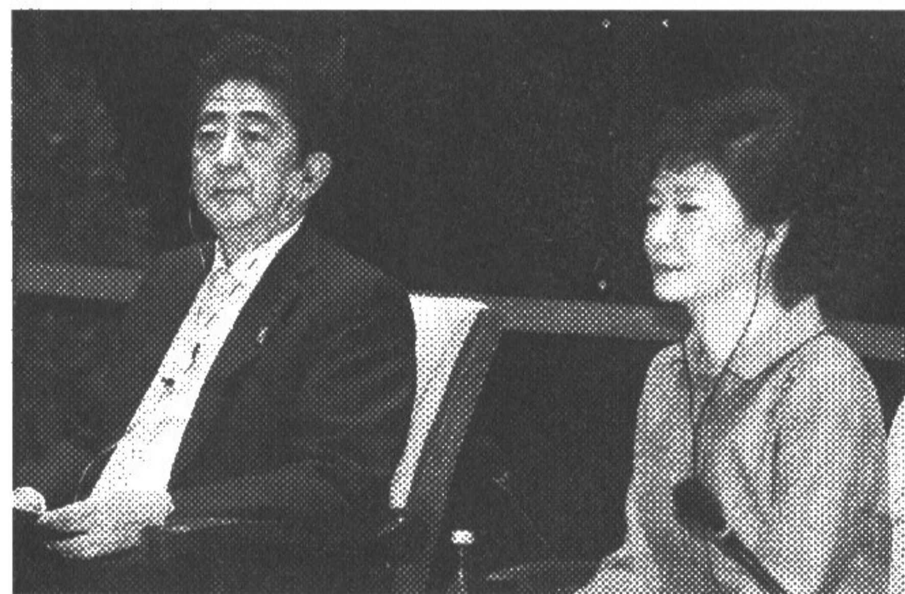
「世界の中心」で反日を叫ぶ

由で挺対協が政治力を使い、入国禁止にしてしまったくらしい。挺対協は親北なので、日本と韓国が仲良くするの